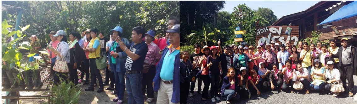
สหกรณ์ฯ นำสมาชิก กรรมการ และเจ้าหน้าที่ รวม 42 คน เดินทางไปทัศนศึกษาดูงานด้านเศรษฐกิจพอเพียง ณ สวนศรียา (ลุงไสว) จ.นครนายก (6 ธ.ค. 58)