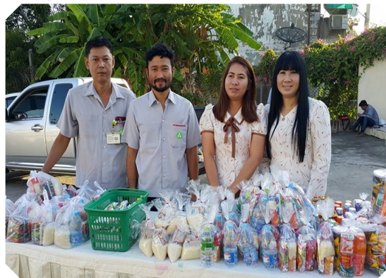
สภกรณ์ฯ ร่วมตักบาตรข้าวสารอาหารแห้ง ร่วมกับสหภาพแรงงานไทยเรยอน (31 ต.ค. 58)