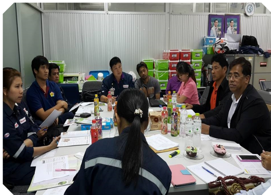
นายก สสอป. และกรรมการ ชี้แจงการดำเนินงานที่ ศูนย์ประสานงานสอ.เอสโซ่ฯ จ.ชลบุรี (17 ธ.ค. 58)