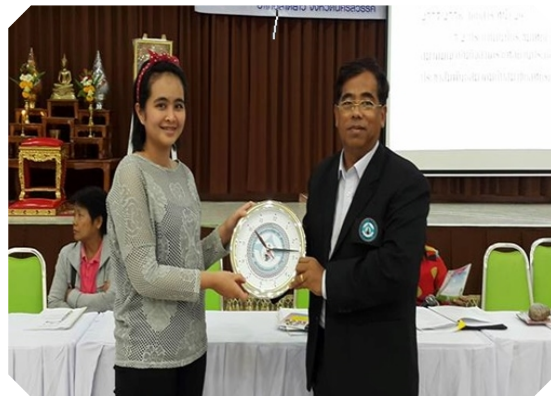
นายก สสอป. เข้าร่วมการประชุมใหญ่ สอ.พนักงน สหกรณ์นครสวรรค์ จ.นครสวรรค์ (18 ธ.ค. 58)