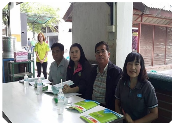
ที่ปรึกษา รองประธานฯ และผู้จัดการ เข้าร่วมประชุมใหญ่สามัญประจำปี สอ.พนักงานบริษัท รอยัล ปอร์ซเลน จำกัด จ.สระบุรี (30 พ.ย. 58)